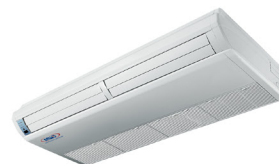
UNIDAD INTERIOR TIPO PISO CIELO