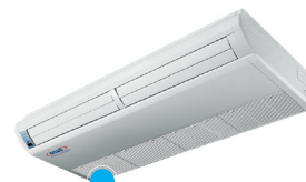
UNIDAD INTERIOR TIPO PISO CIELO