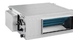
UNIDAD INTERIOR TIPO DUCTO