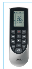
Control Remoto, Equipo Tipo Muro