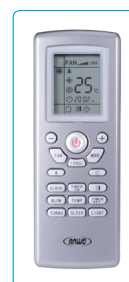
Control Remoto, Equipo Tipo Cassette