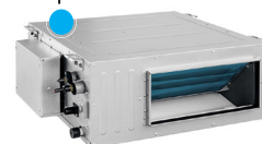
UNIDAD INTERIOR TIPO DUCTO