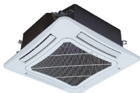
UNIDAD INTERIOR TIPO CASSETTE