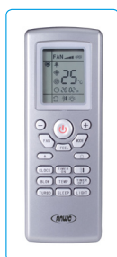
Control Remoto, Equipo Tipo Piso Cielo