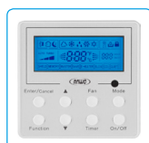
Control Alámbrico, Equipo Tipo Ducto