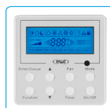
Control Alámbrico, Equipo Tipo Cassette