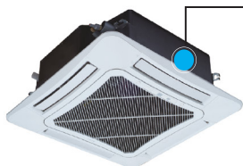
UNIDAD INTERIOR TIPO CASSETTE