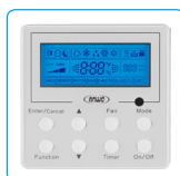
Control Alámbrico, Equipo Tipo Piso Cielo